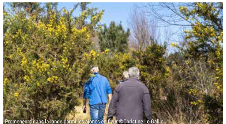
Promeneurs dans la lande parmi les ajoncs en fleur

6 A Kerlavarec, continuez tout droit sur la route en ignorant les voies à gauche. A l'approche de la voie express, allez à droite dans le sous-bois et longez la route. Au bout, remontez à droite vers Kerentestec et le point de départ.