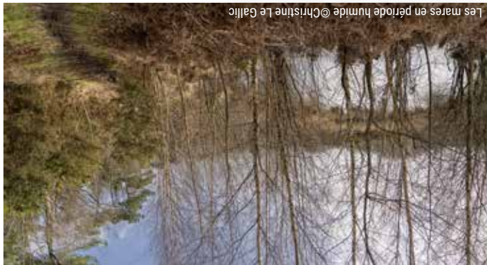
Les mares en période humide