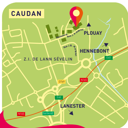
Centre de tri des emballages Adaoz