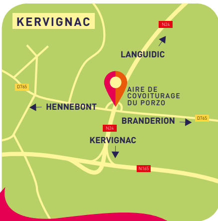
Point de rdv pour les visites vers le Centre de stockage de Kermat