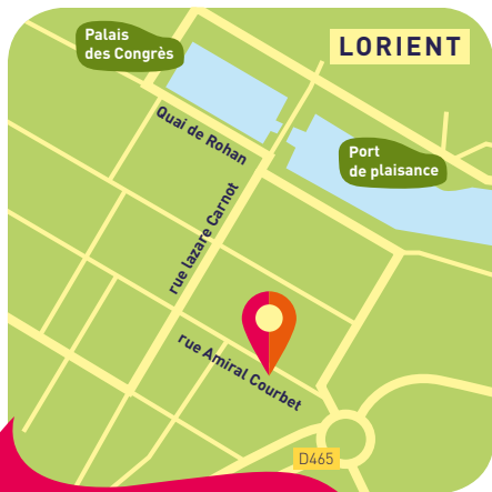
Espace Courbet (Agora) Conférence & festival