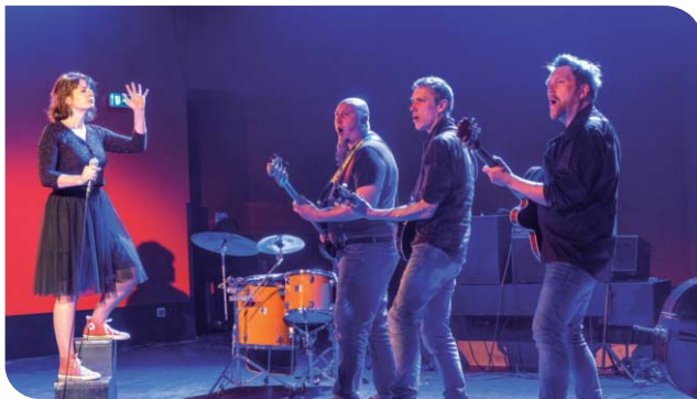
Languidic a accueilli le festival breton Les Deziou organisé par Emglev Bro an Oriant devant un public ravi.