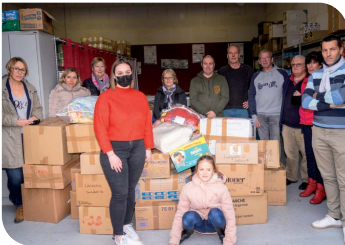
Collecte de produits de première nécessité à destination de l'Ukraine avec les bénévoles de Languidic Solidarité.