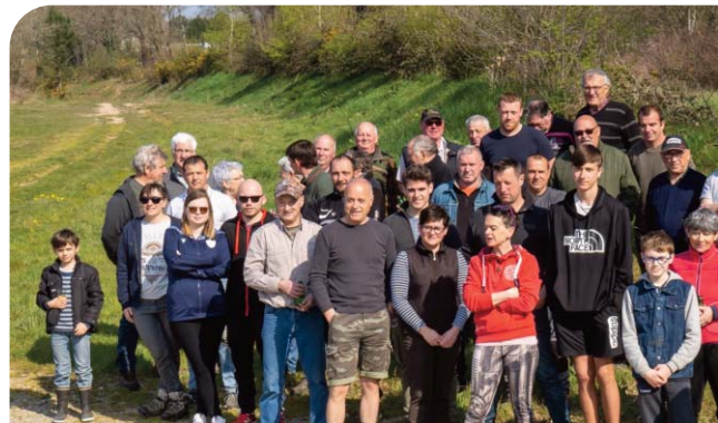
"Nettoyons la nature" Près de 80 bénévoles ont participé à la matinée éco-citoyenne.