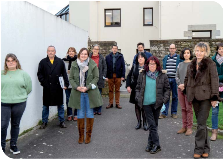
Les 12 agents recenseurs ont sillonné la commune tout le mois de janvier.