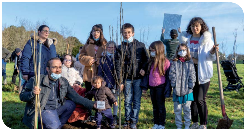
Opération « Un enfant-Un arbre » avec l'association Loca-Terre, 49 familles dont les enfants sont nés en 2020 ont répondu à l'invitation pour une plantation de poiriers à la Forêt 2 000 de Kerentestec.