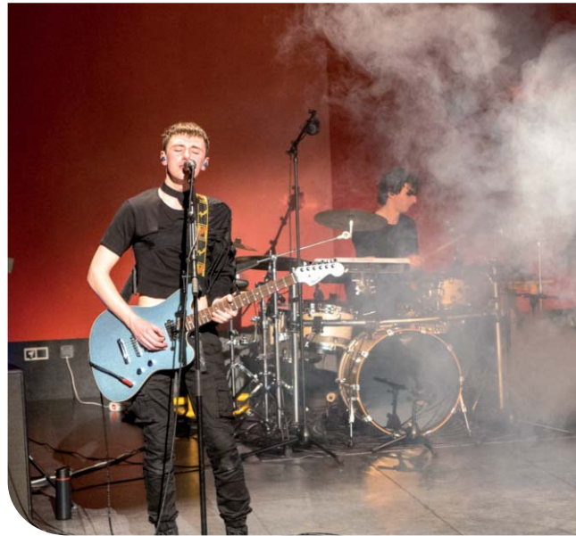
MNTR, le groupe rock alternatif accueilli en résidence à l'Espace des Médias et des Arts.